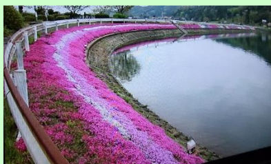
芝桜での景観形成活動