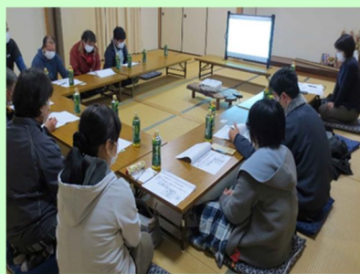
男女参画の意見交換会