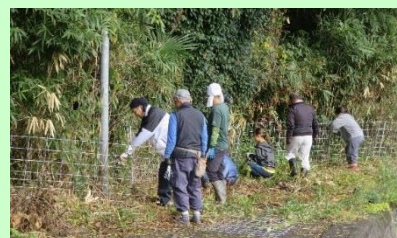
地域一体となった鳥獣被害対策