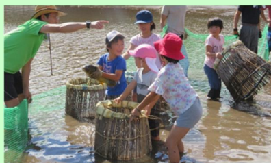
伝統漁法のウグイ突き漁

ウグイ突き漁、景観形成活動、草刈り、水路清掃、鳥獣害防護柵の設置などの活動に大学生がボランティアとして参加するとともに、地元小学校からも郷土学習として参加しています。また、地元青年団に所属する若い世代も、活動組織指導のもと、農業用施設の補修活動を実施しています。