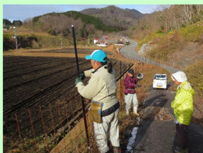
地域一体型の鳥獣被害対策

地域としては約30年、活動組織としては約10年、転作田の有効活用と多様な交流の拡大を目指してひまわりの植栽を続けており、「あったか村川とひまわりまつり」では毎年多くの観光客が訪れ賑わっています。また、遊休農地の活用と農業経営基盤の強化に向けて、農業法人を中心にもち麦を栽培して六次産業化に取り組んでいます。