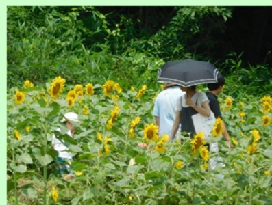
ひまわり植栽による景観形成活動