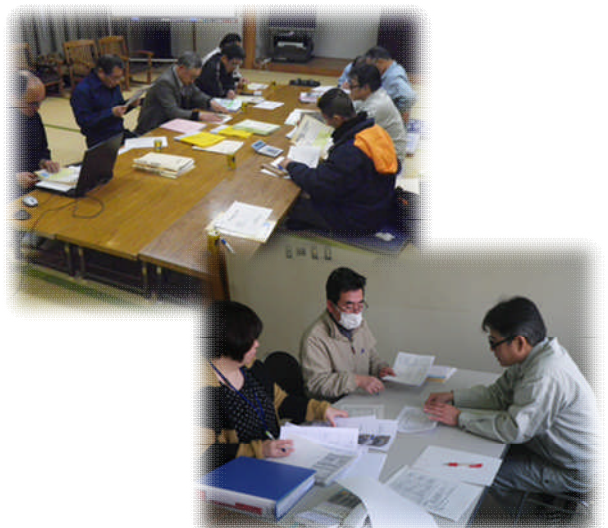
組織と市町村が一体となり説明