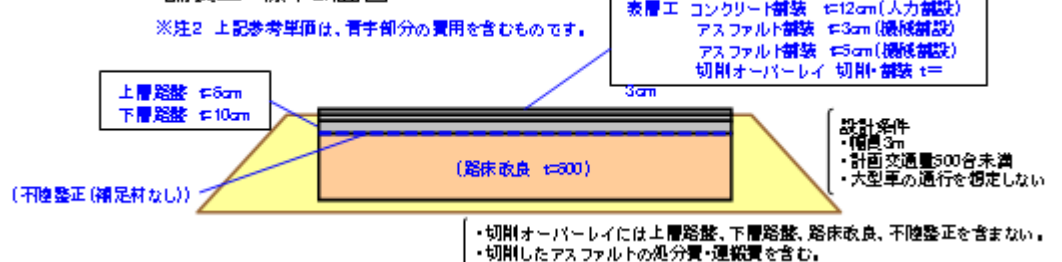
舗装工 標準断面図