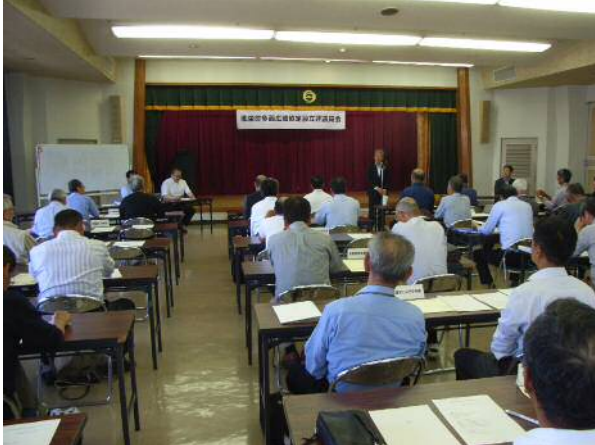
設立評議員会の様子