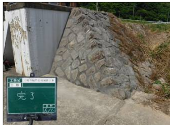
石積みをモルタルで補修