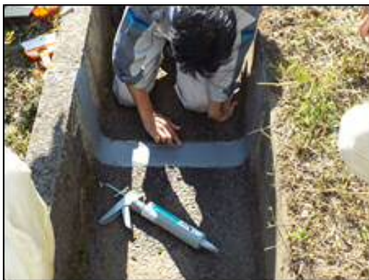
一般的な目地補修

研修で使用する材料代等は、水土里ネットとっとり(協議会事務局)が負担いたします。