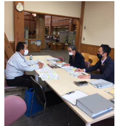
訪問相談会の様子（日南町）