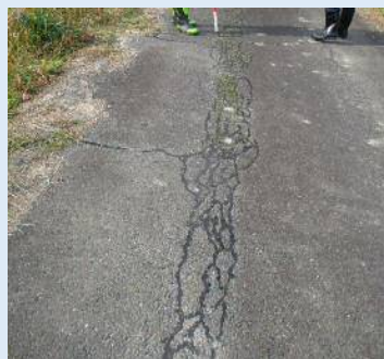
アスファルトの亀裂補修