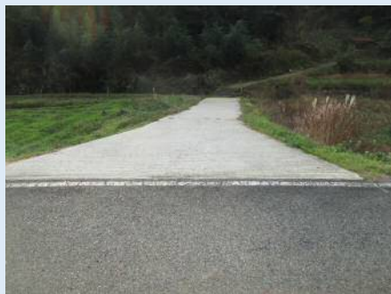
農道のコンクリート舗装