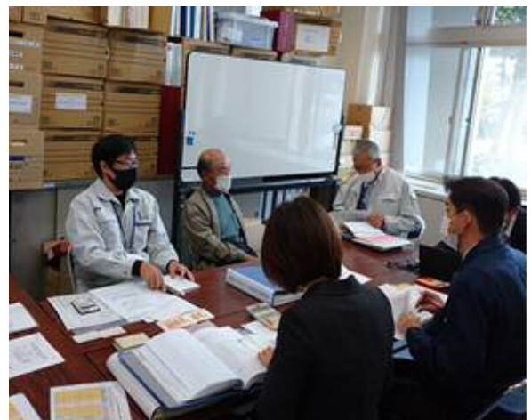
琴浦町並びに北栄町での検査