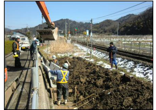
老朽化水路の更新工事