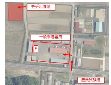
モデルほ場位置図